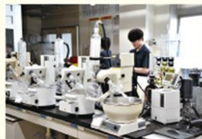
最新技術を使って検査をします

北陸環境科学研究所は、身の回りのいろいろな物の検査をすることで、みなさんの安心・安全な生活を守るお仕事をしています。水道の水や食べ物など健康に関することから、工場から出る排水、煙突のけむりといった環境に関することまで、はば広く検査をしています。